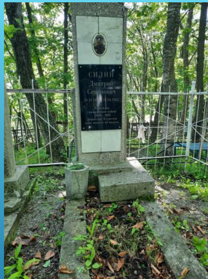
Посещение могилы Д. С. Силина